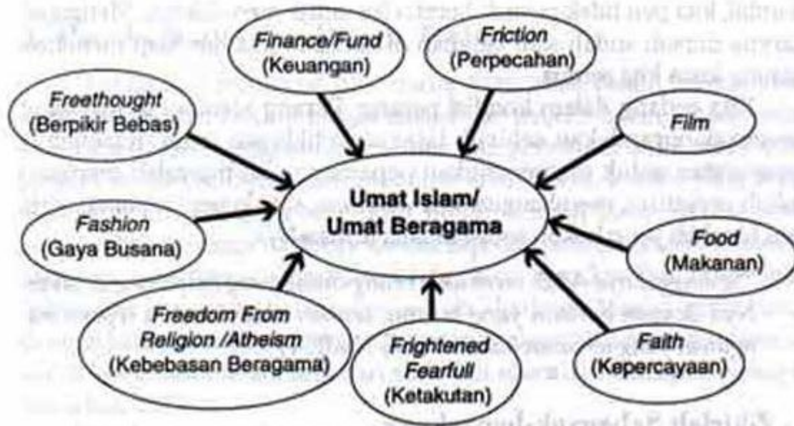
Gambar 14: Jaringan Dajal sebuah Gerakan Kafirisasi Global